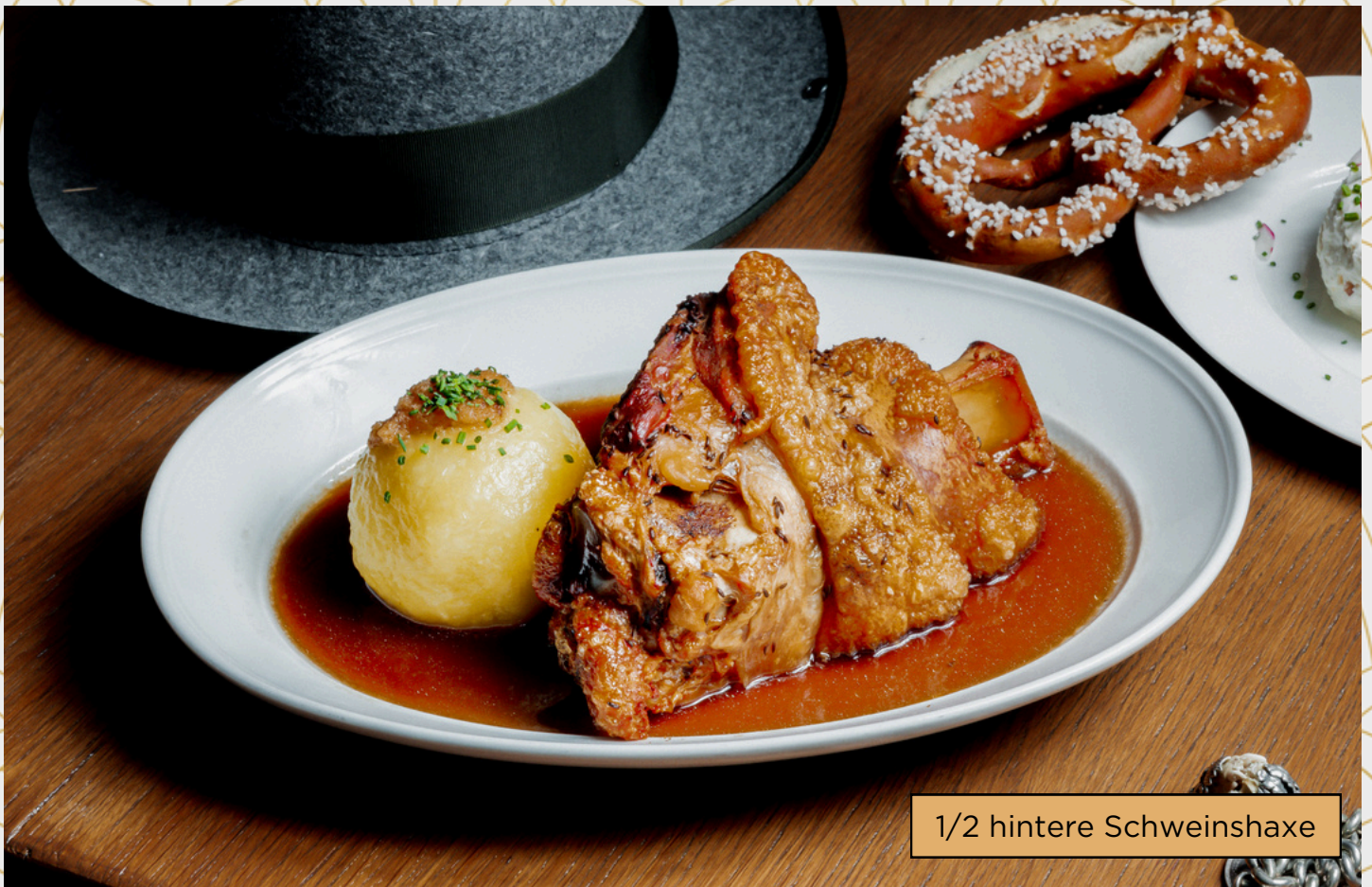
1/2 hintere Schweinshaxe